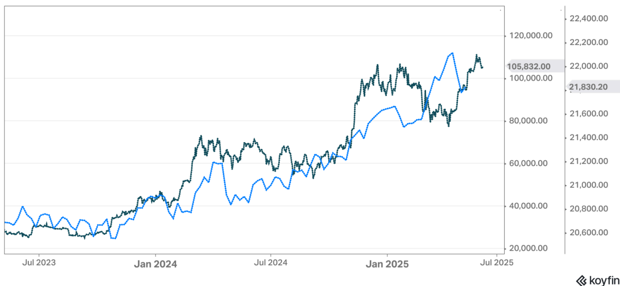
Gráfico 1 – Evolução dos preços do bitcoin e a comparação com o M2 global.